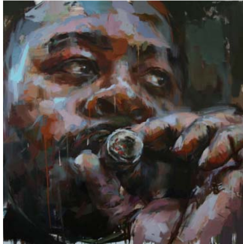
« smoker », jerome lagarrigue, 200x200 cm

Des visuels en haute-définition sont disponibles sur simple demande auprès de la galerie Mention obligatoire : courtesy galerie olivier waltman, paris