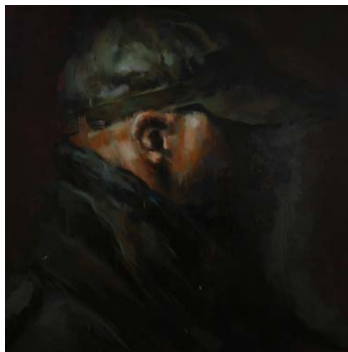
« autoportrait de nuit », jerome lagarrigue, 150x150 cm