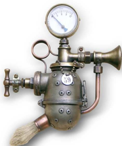
no art – grenade à essuyer les plâtres