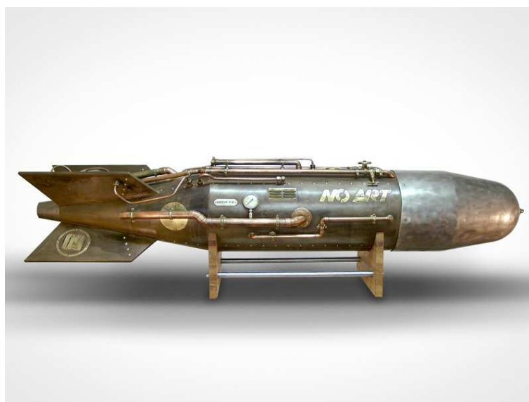
no art – exocet2salon