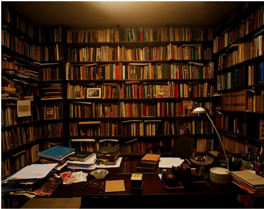
série author's spaces ( haïm be'er ), c-print, ed.6, 100 x 120 cm