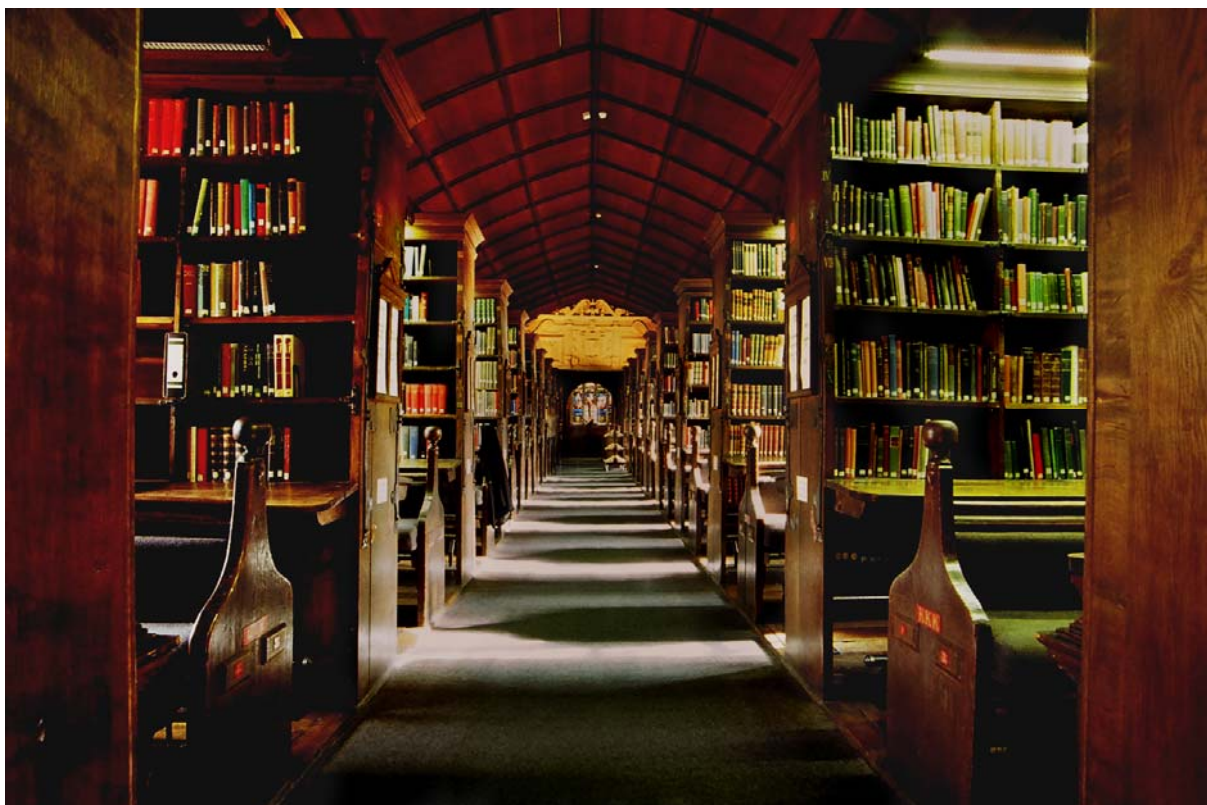
série libraries , c-print, ed. 6, 70 x 105 cm

La photographe israélienne Tali Amitai-Tabib, avec sa série authors spaces achève un cycle d'observation de et questionnement des lieux d'histoire et de culture.