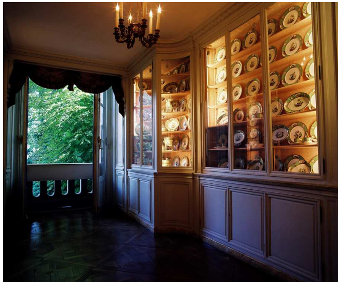
série camondo – c-print, ed.6