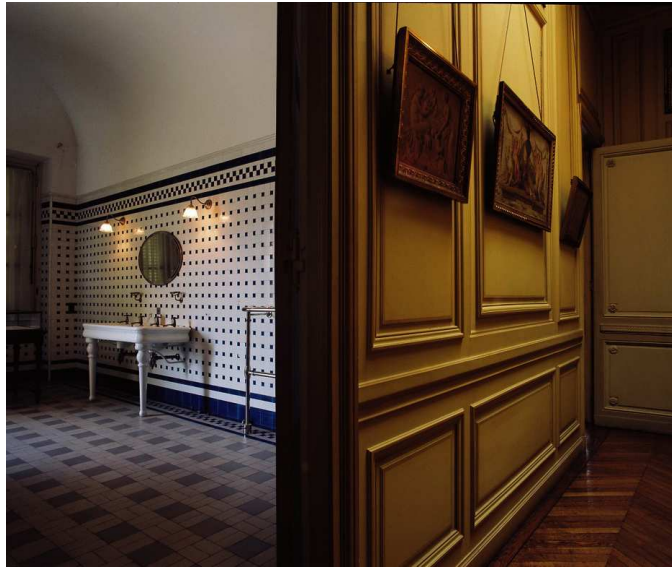
série camondo – c-print, ed.6

Des visuels en haute-définition sont disponibles sur simple demande auprès de la galerie