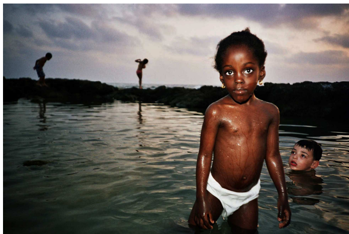
Odélie - série Lomo – c-print, ed.6