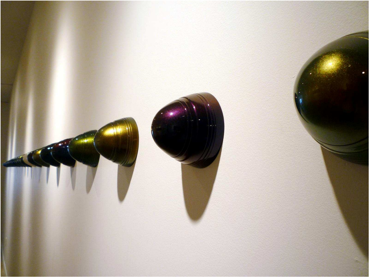
Jorge ENRIQUE Low Ride Spheres Installation