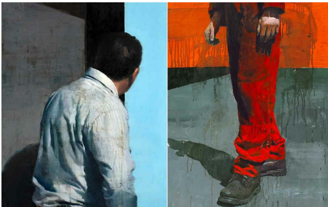
François Bard, L'autre côté , Huile sur papier, Oil on paper, 75 x 53 cm, 2021 – François Bard, Le seul jour , Huile sur papier, Oil on paper, 75 x 53 cm, 2021

D'une rive, l'autre. En franchissant la Seine pour s'installer dans la rue du Perche (3e), la galerie Olivier Waltman n'abandonne pas son implantation de la rue Mazarine (6e).