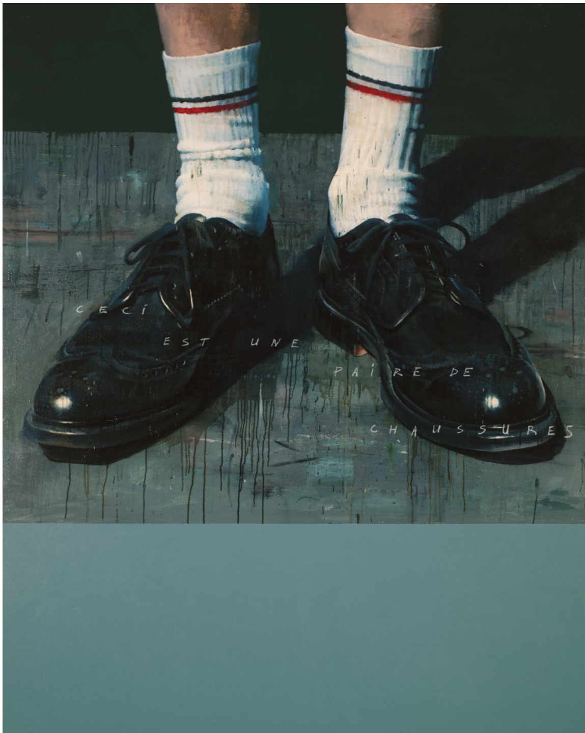
François Bard, Ceci est une paire de chaussure , Huile sur toile, Oil on canvas, 161 x 130 cm, 2021

Pour son premier accrochage dans le Marais, Olivier Waltman frappe un grand coup – ainsi que les esprits – tout en confirmant la montée en puissance du Marais aux yeux des galeristes internationaux dont plusieurs (David Zwirner, Lévy Gorvy...) ont récemment choisi d'élire domicile dans le quartier. Welcome !